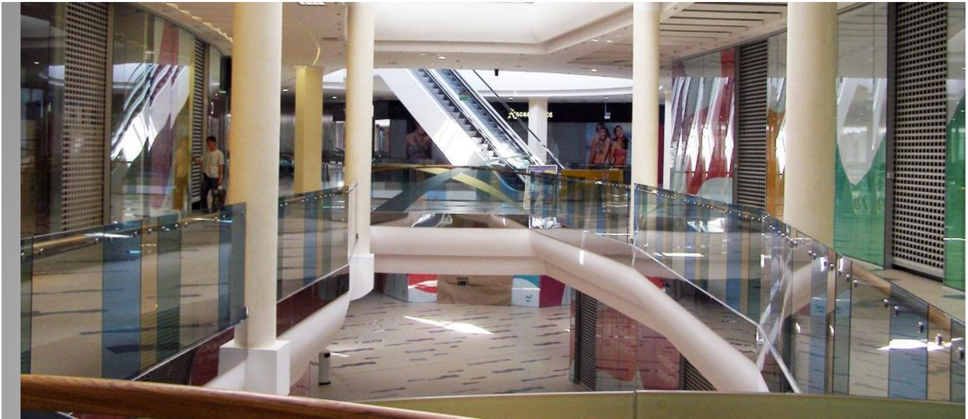
ТРЦ «Sky Mall», г. Киев