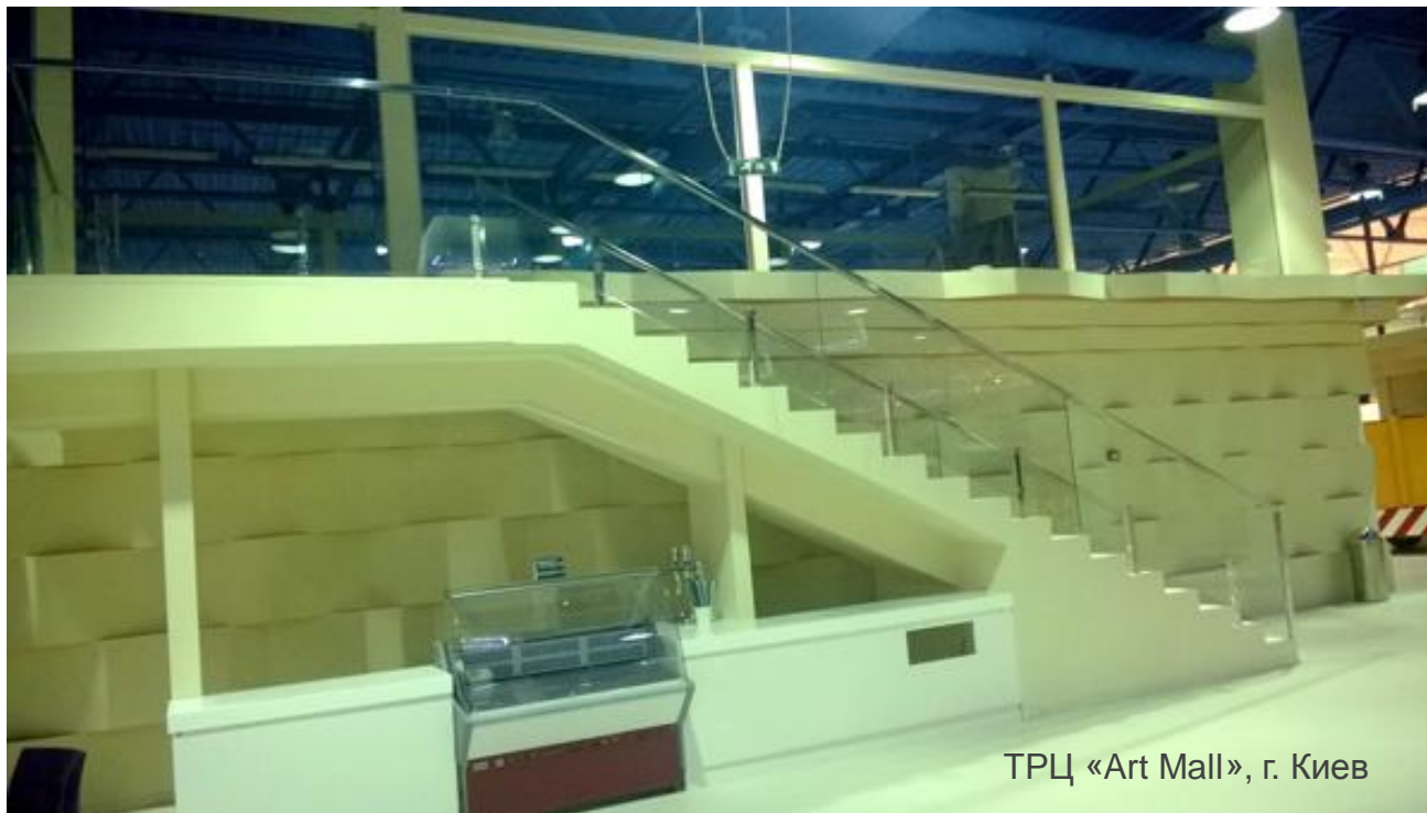
ТРЦ «Art Mall», г. Киев