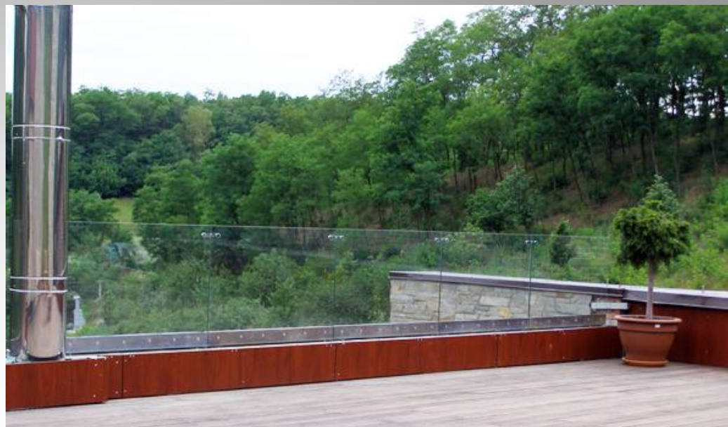
Частный дом, Киевская обл.