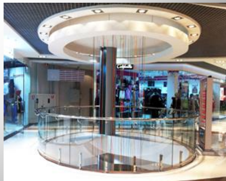
ТЦ «Параллель», г. Киев