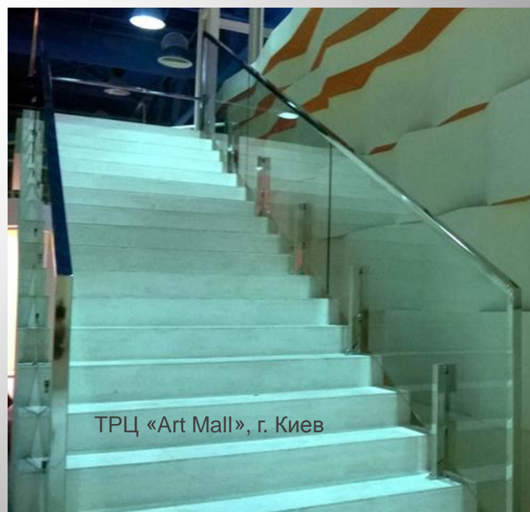
ТРЦ «Art Mall», г. Киев