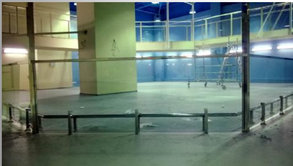
ТРЦ «Art Mall», г. Киев

Самым популярным материалом для изготовления поручней стеклянных ограждений является нержавеющая сталь или дерево.